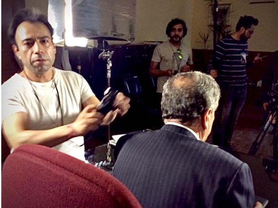
Ilustración 6.- Raúl Molina. Director de fotografía

toluqueños a Europa para formarse y volver a la ciudad para que fueran ellos los encargados de diseminar el arte contemporáneo en la renaciente ciudad de Toluca.