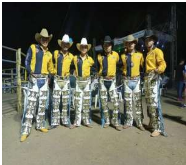
Imagen 41: Cuadrilla de jinetes en 2020

En la actualidad, de acuerdo al “Tesorito” de San Simón, “el jinete debe tener la característica de estar bien presentable (bien guapo) en su vestimenta al momento de montar el toro, pues es su herramienta de presentación”, esto inicio como una norma entre los jinetes, utilizando playeras o camisas vaqueras acompañadas de chalecos de cuero, pantalón de mezclilla entallado, hebilla y botines.