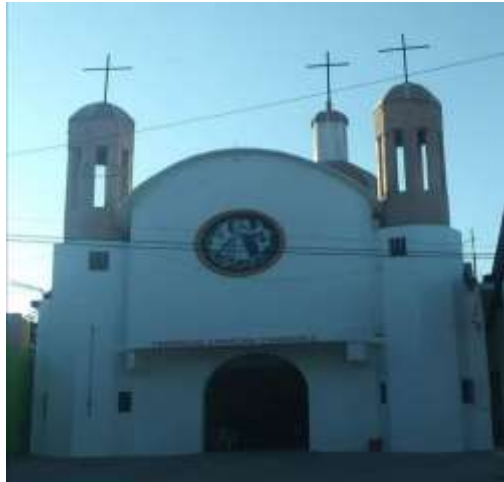
Imagen 28: Parte exterior de la iglesia Católica San Pablo y San Pedro Riva Palacio, Michoacán, Trabajo de Campo, septiembre, 2015.

La iglesia cristiana EBEN EZER, el templo del salón del reino de los Testigos de Jehová, la iglesia denominada Luz del Mundo y el Templo Cristiano de Jesús,