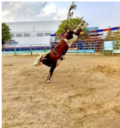
Imagen 32: Ensayo de toros de jaripeo dentro del rodeo San Miguel. Trabajo de Campo, 2022.