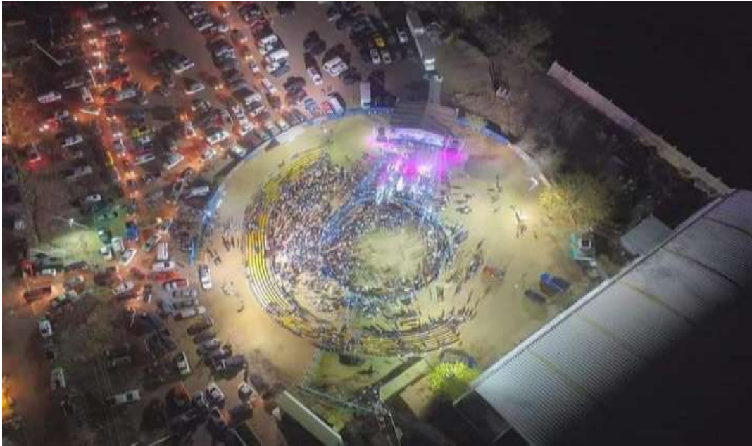
Imagen 54, Vista aérea por un dron rodeo San Miguel

Se da inicio con las primeras canciones por parte de la banda, siguiente presentación es la del animador del evento para que haga también su presentación en el centro de la plaza, el animador casi siempre lleva vestimenta igual a la de un jinete (botas y camisa) este es un momento de gran importancia en términos de la dimensión ritual propia del jaripeo.