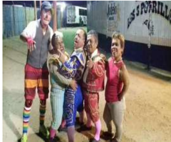
Imagen 49: “Payaso Polvorín” Rodeo San Miguel. Trabajo de Campo, 2022. imagen 40: Personas de talla baja a su show, rodeo San Miguel. Trabajo de Campo, 2022.

Innovándolo el cual al interactuar con los asistentes principalmente o en pocas ocasiones con integrantes de la agrupación musical o los jinetes, otra “atracción” son los del show denominado de los “enanitos” toreros (personas de talla baja) que estos son esporádicamente contratados ya que tiene un costo más elevado que el tradicional payaso, el show de los “enanitos” toreros depende de los integrantes que asistan, la función principal es atracción de los niños y adultos de los asistentes parte del show, es hacer un show de jaripeo montas a pequeños toros pony, además de interpretar a comediantes o cantantes que estén de moda (Trabajo de Campo, 2015).