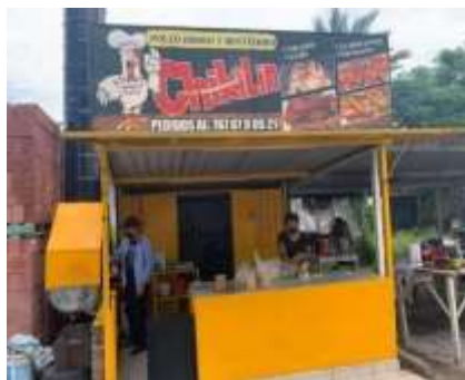
Imagen 18: Establecimiento de venta de pollo en el mercado de Riva Palacio, Trabajo de campo 2015.

Un porcentaje importante de la población se dedica a las actividades del sector del comercio un 30% de la población se dedica a esta actividad, se registran cerca de 50 establecimientos de pequeños comercios (Fuente censo económico INEGI 2019), derivado que es un lugar accesible para mucha población y varias empresas, se han asentado ahí como lo son bodegas de almacenamiento de grupo Femsa, Lala, Grupo Modelo, Grupo Coripasa, Fábrica de Hielo Laurita, Empacadoras de melón y sandía, 2 gasolineras, 2 hoteles con 50 cuartos cada uno.