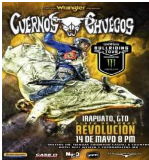
Imagen 42: Concurso denominado estilo rodeo estadounidense

Poco a poco a través del tiempo se fue haciendo costumbre el uso de sombrero texano (de estilo de los cowboys norteamericanos).