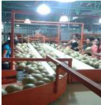
Imagen 19: Mujeres lavando el melón para ser empaquetado y exportado “Legumbrera San Luis S. A. de C. V” Ubicada en Riva Palacio, Trabajo de Campo, 2022

espacio para dar servicios como servicios de la salud y ámbito legal (Trabajo de Campo, 2015).