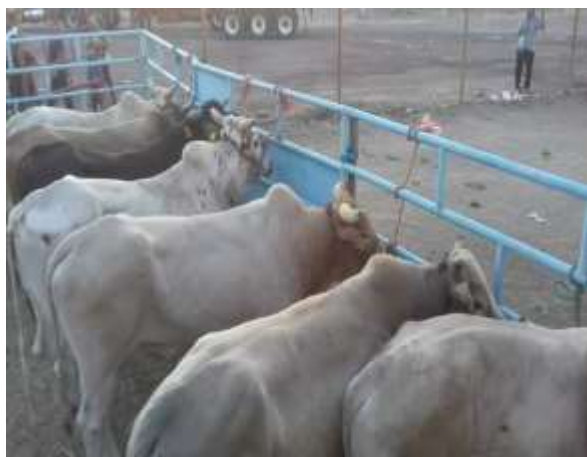
Imagen 37: Toros sujetos a paneles metalicos en el rodeo San Miguel. Trabajo de Campo, 2022.

De acuerdo a las entrevistas de diferentes ganaderos en 2015, se comenta que sí algún toro no nació para reparador, es un toro que no servirá de mucho dentro de un jaripeo. Para eso, el propietario del toro debe darlo de baja de su corrida estelar lo que significa que ya no será usado como toro de reparo, se le puede dar uso como semental para toros de reparo, puede ser vendido para la carne en el rastro o ser vendido como animal para engorda, de lo contrario si el ganadero lo sigue presentando en un jaripeo como parte de sus toros estelares su prestigio en el ambiente del jaripeo irá en declive, de igual manera, sí el toro ya es adulto para reparar, este terminará siendo un toro inútil para el jaripeo, pero será valioso sí llega a dejar crías igual de reparadoras y espectaculares como él .