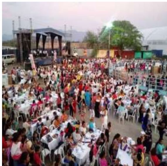
Imagen 26: Celebración Día de las Madres Riva Palacio Michoacán. Trabajo de Campo, septiembre, 2015.

La población de Riva Palacio basa su diversión en ámbitos culturales sociales o deportivos en alusión a algún festejo de la tenencia para eso la mayoría de eventos sociales se da cuando muchos migrantes calentanos regresan a visitar a la familia o para asistir a algún festejo en la región.