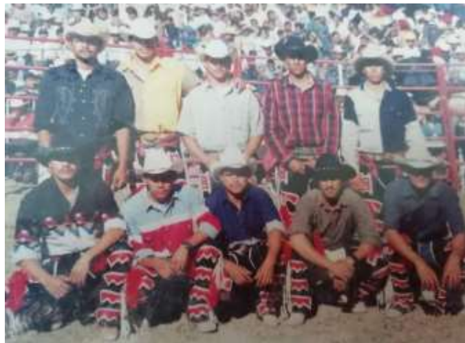
Imagen 39: Extraída de Facebook 2022 cuadrilla de jinetes, 1990

Esto es el uso de botas, camisas vaquera y pantalón de mezclilla entallado, en los años noventa era común el uso de un pañuelo que se amarraba fuertemente en la cabeza del jinete.