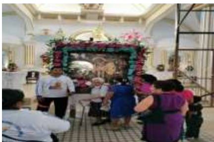
Imagen30: Peregrinos rumbo a la Iglesia de San Lucas, Michoacán Riva Palacio, Michoacán. Trabajo Campo, 2015.

Las fiestas pueden ser religiosas o cívicas, existe una estrecha relación entre la curia católica y la administración pública de la localidad el calendario está marcado por todo el año.