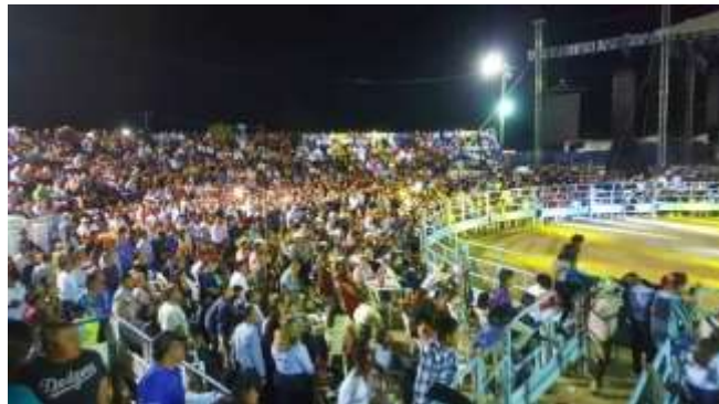
Imagen 48. Público asistente al rodeo San Miguel. Trabajo de Campo, 2022.

En el transcurso del jaripeo se rompen status de conocimiento, ya que en él se manden recíprocamente un cordial saludo de lado a lado del rodeo por medio del animador ya que este camina en todo el ruedo, o que "de la nada" arribe una botella con alcohol para un hombre del público por parte de otro hombre que asistió al evento, ya que estos pueden compartir lazos de parentesco consanguíneo algunos o de previa amistad. El ritual de asistentes al jaripeo no existe una división de clases sociales marcada, debemos argumentar que la mayoría de los asistentes son hombres debido a la identidad que sienten por el jaripeo, frente a un número reducido de mujeres que acompañan a sus familiares o a su marido o están cuidando a sus hijos que pidieron asistir al evento con ello (Trabajo de Campo, 2015).