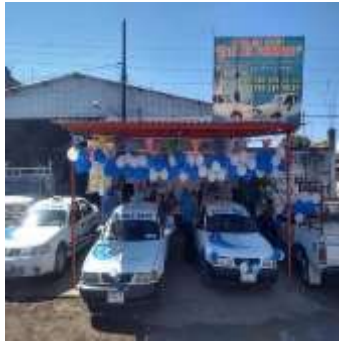
Imagen 20: Sitio de taxis de Riva Palacio Michoacán. Trabajo de campo marzo, 2022.

El boom económico y comercial de la zona sur del municipio de San Lucas Michoacán, lo encabeza la tenencia de Riva Palacio, esta localidad se ha convertido en el centro económico más importante del municipio desde fines de los setenta, rebasando por mucho la cabecera municipal, aunque aún carente de infraestructura y servicios públicos adecuados (Trabajo de Campo, 2015).