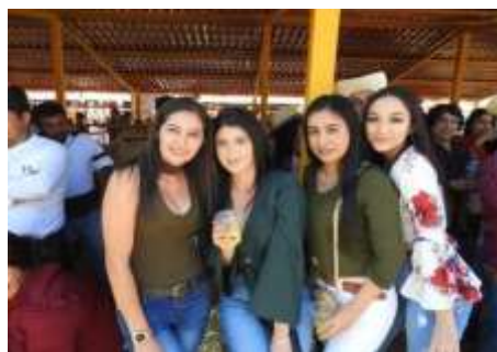
Imagen 25. Asistentes femeninas en la expo feria de Zacazonapan México

Los jóvenes basan su vestimenta en tipo cholo, significado que se le han dado al término cholo es que el “show low” está basado en la forma de caminar y moverse o “indio” por las condiciones de vida de los migrantes chicanos el “cholismo”, es más que una conducta socialmente desviada, lo que expresan.