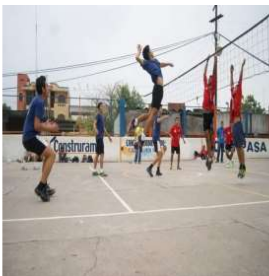
Imagen 27: Juego de voleibol entre jóvenes Riva Palacio, Michoacán. Trabajo de Campo, septiembre, 2015.

Es frecuente la contratación de grupos musicales en las bodas, quince años o alguna otra festividad, los jaripeos- bailes amenizados con estas bandas de música son por lo regular, a campo abierto con acceso para toda la población de la región con comida gratis para todos los asistentes, no obstante, se vende la cerveza y lo que se recaba se utiliza para el pago de la música y otros gastos de la fiesta organizada. Este tipo de bailes se llevan a cabo en el día o noche. Y son bailes masivos a donde asisten personas de toda la región, dependiendo del grupo y toros que amenicen la fiesta, y los más concurridos se realizan en las dos últimas semanas de diciembre (Trabajo de Campo, 2012).