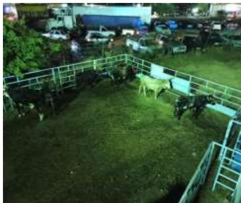
Imagen 33: Toros en las corraletas del rodeo San Miguel. Trabajo de Campo, 2022.