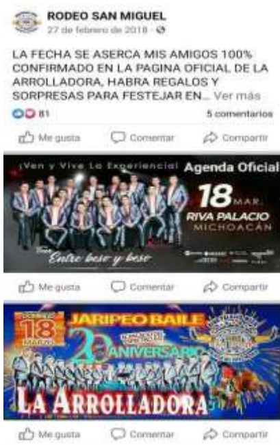
Imagen 55: Promoción de evento en Rodeo San Miguel, (Extraída de Faceebok,https://m.facebook.com/story.php?story_fbid=2041592506098764&id=1726993774225307 , 12 de mayo 2022).

La tradición oral en el rodeo San Miguel va de la mano con la cultura popular, pues son elementos forjadores de la supervivencia del jaripeo, esto a su vez trae consigo la generación de redes y roles sociales mediante las prácticas culturales, pues entre los protagonistas y asistentes se genera, formaliza y adhesión, la convivencia que va más allá del rodeo San Miguel. Estas historias se encuentran dotadas y rescatadas de un talento valioso del lenguaje oral, puesto que es descrito presencialmente y conserva la emotividad del protagonismo, en el rodeo San Miguel la transmisión de la tradición oral del jaripeo, es presencial y generacional, las historias varían de acuerdo a los grupos de edad que han pasado de boca en boca a través de las varias generaciones, donde se da una rápida propagación de la información.