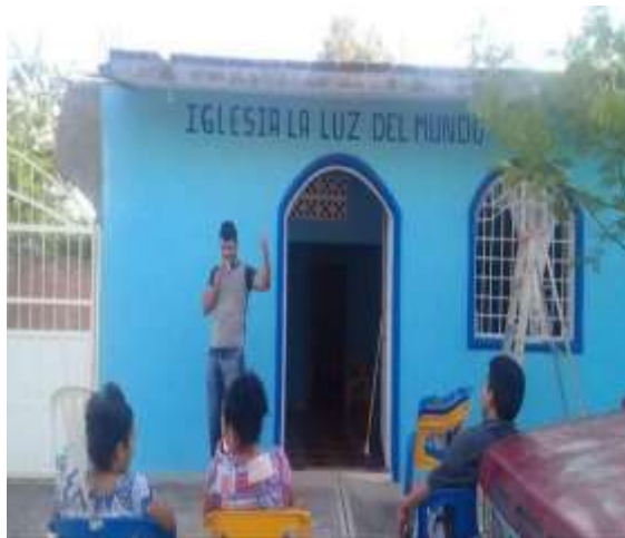
Imagen 29: Parte exterior de la Iglesia de la Luz del Mundo, Riva Palacio Michoacán. Trabajo de Campo, septiembre, 2015.

La iglesia cristiana EBEN EZER, el templo del salón del reino de los Testigos de Jehová, la iglesia denominada Luz del Mundo y el Templo Cristiano de Jesús,