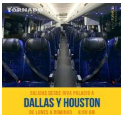
Imagen 24: Fotografía tomada a volante comercial de servicio de autobuses, Riva palacio Michoacán, Trabajo de Campo, 2015.