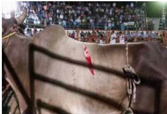
Imagen 34: Toro cortado por la espuela de un jinete

considerado como un ente masculino en una lucha férrea de fracción de minutos contra el jinete, entendido que es parte del espectáculo que se presenta en el rodeo.