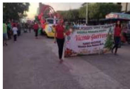
Imagen31: Aniversario de la tenencia de Riva Palacio, Michoacán. Riva Palacio Michoacán. Trabajo de Campo, 2015.

Calendario de fiestas (trabajo de campo 2012)