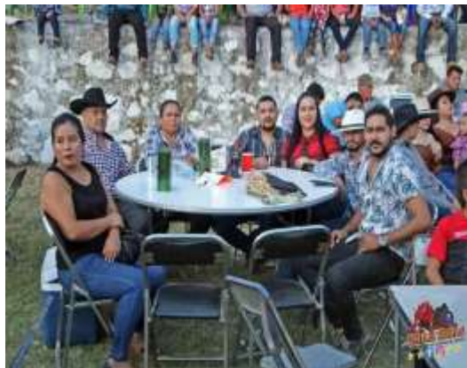
Imagen 57:., Personas disfrutando y consumiendo bebidas alcohólicas en una tarde de jaripeo

El asistente al rodeo San Miguel cumple con ciertas características como la edad, gusto y sexo, otras características que observamos, es que el público asiste con base a que ganadería, jinete o agrupación acudirá al evento, dejando de lado su afición total. Es decir, pueden ir buenos jinetes, pero unos toros que no cumplen sus expectativas o viceversa, ahí asistentes que me dicen que no es necesario asistir cada que hay jaripeo.