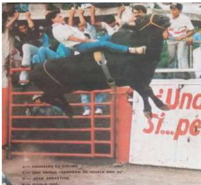
Imagen 44: Monta estilo Colima

Este estilo ha generado una identidad por ser los jinetes de este estado, los primeros en hacerlo famoso. Para algunos jinetes ha resultado ser cómodo que montar con el estilo tradicional de espuelas abajo y sujetados solamente a un pretal de tres hilos.